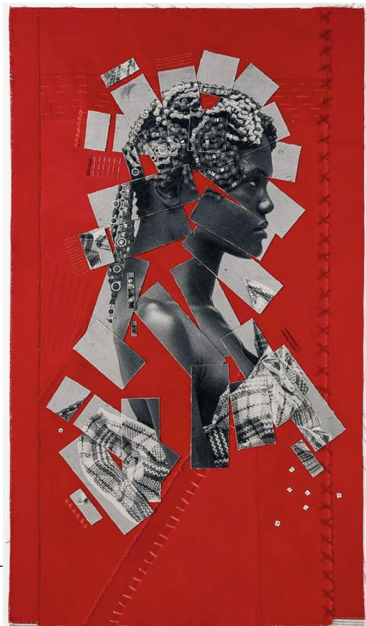
"North" de Justin Dingwall chez Inside-out.