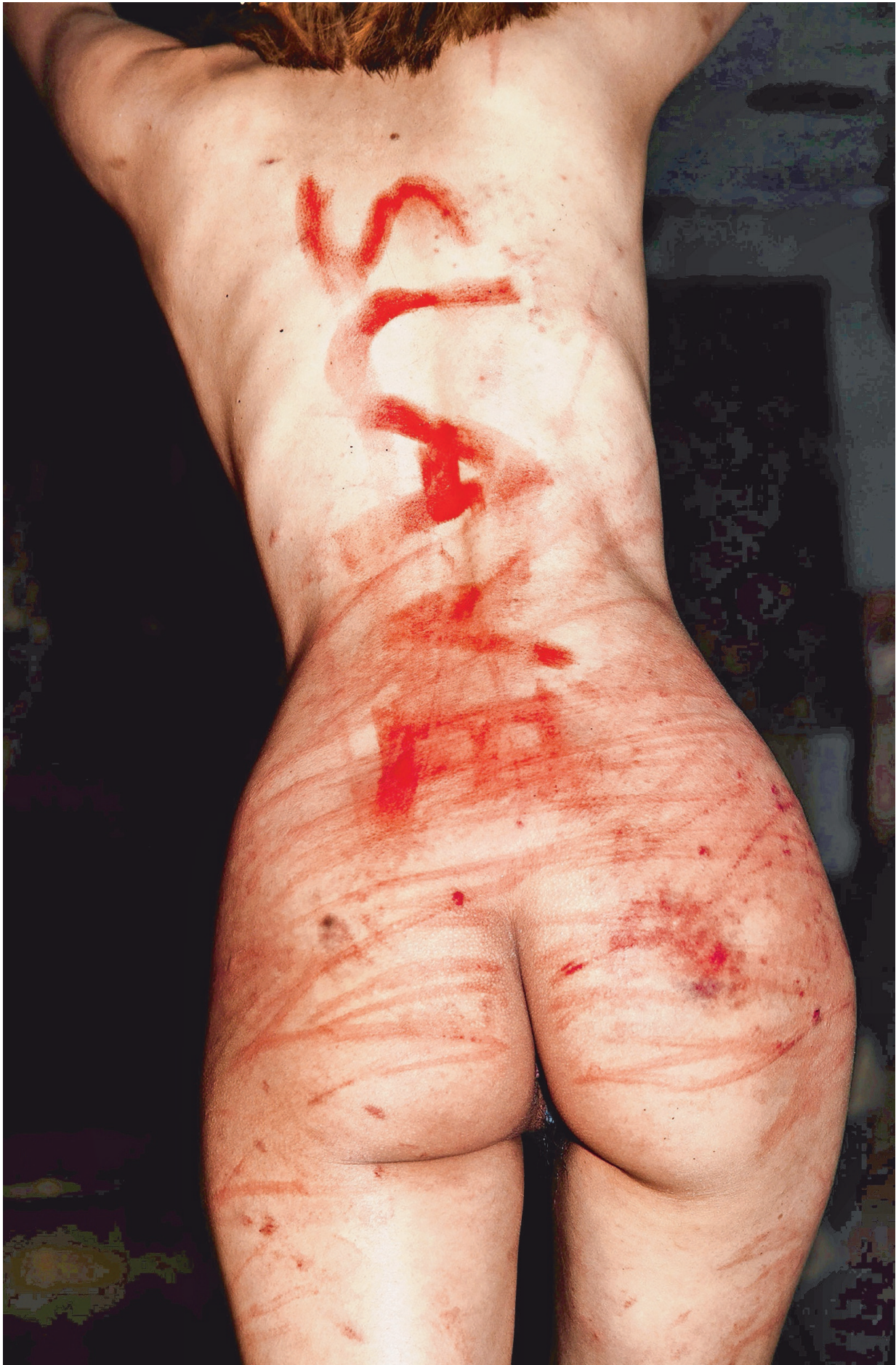
Slave. Sick Girl: 'Bdsm zegt iets over de eenzaamheid en de wanhoop van veel mensen.'