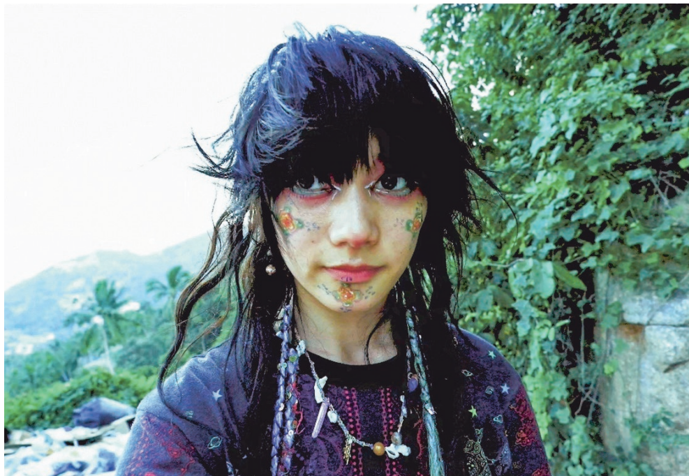
Zelfportret van Sick Girl.