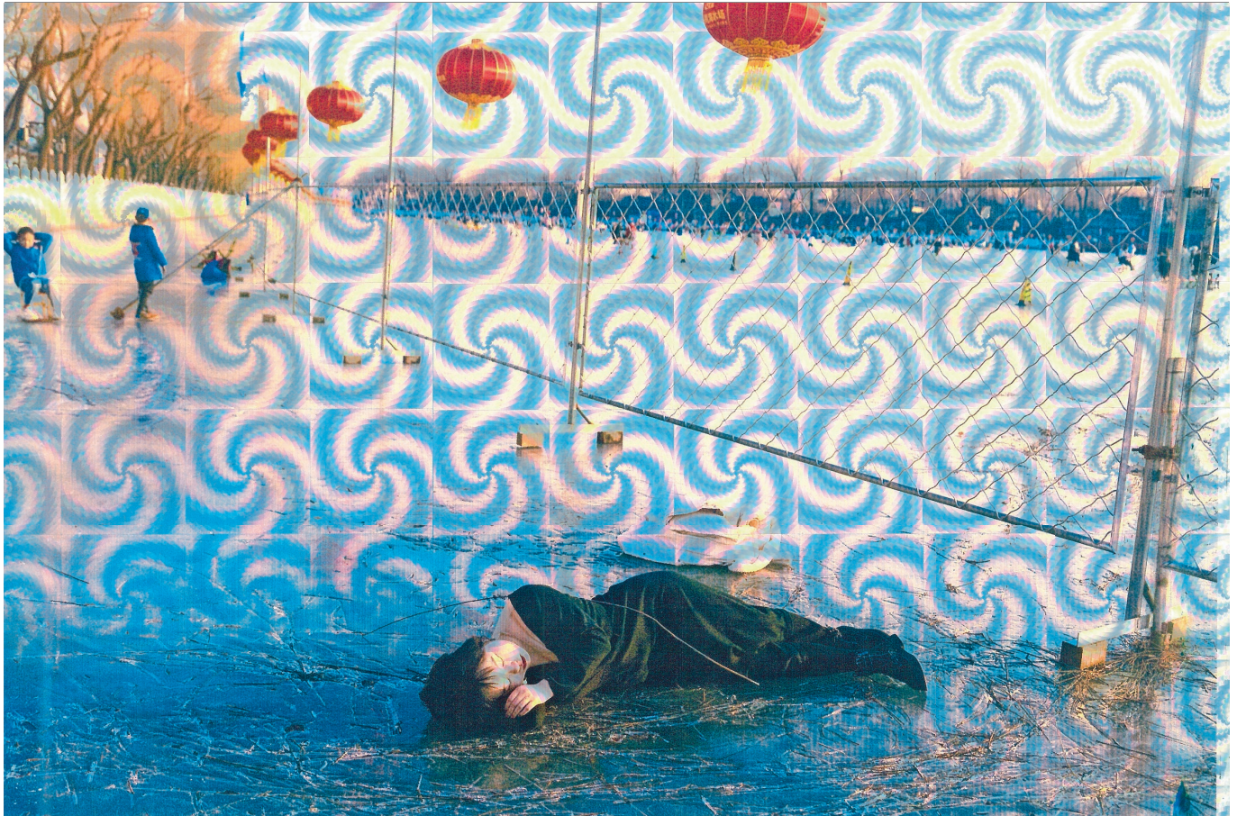
China Dream. 'Digitale fotografie was het ideale medium voor mij, omdat ik het perfect kon integreren in het digitale universum waarin ik al jaren rondzweefde.'